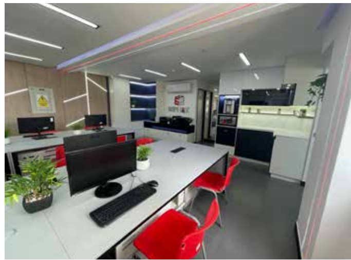
Proyecto Galk - Surco