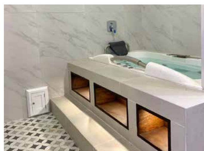
Proyecto Montero - La Planicie