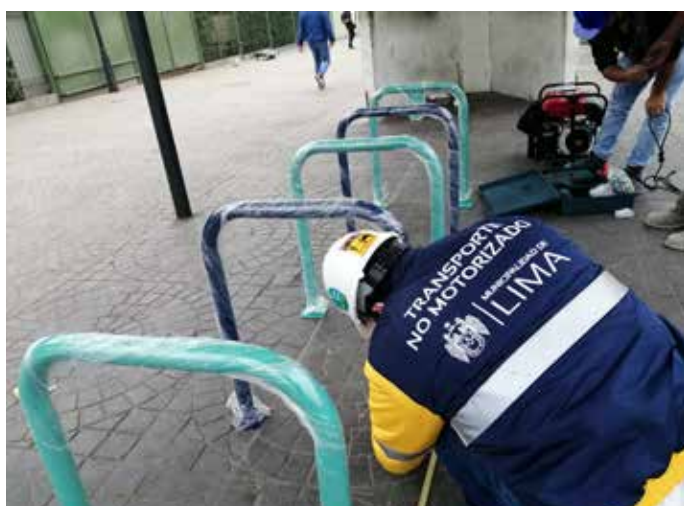
Ejecución ciclovías MML - Varios distritos