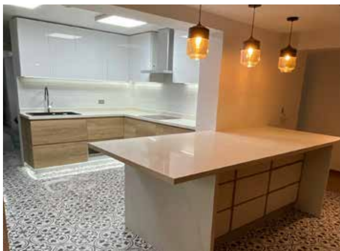
Proyecto Zolezzi - Las Casuarinas