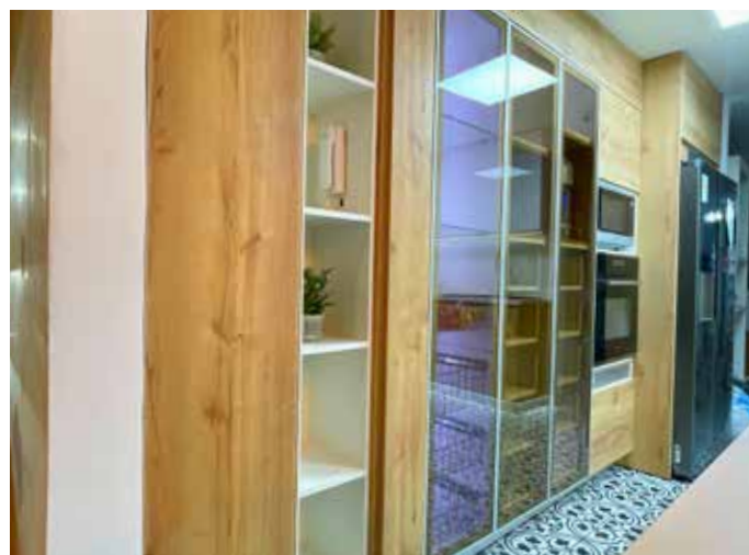
Proyecto Zolezzi - Las Casuarinas