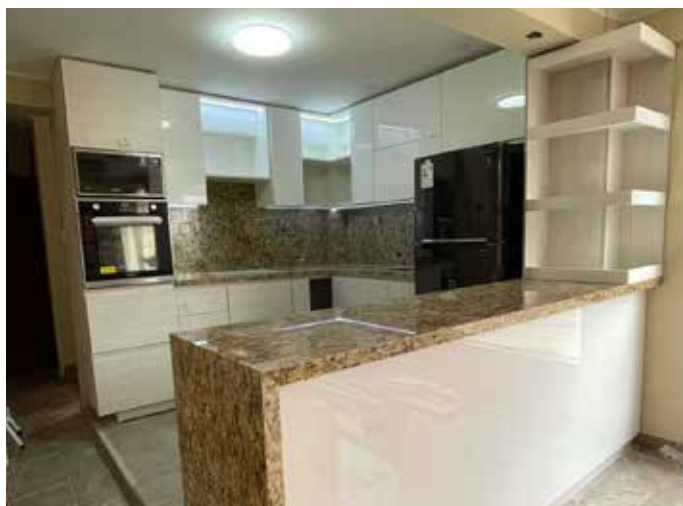
Proyecto Pareja - La Molina