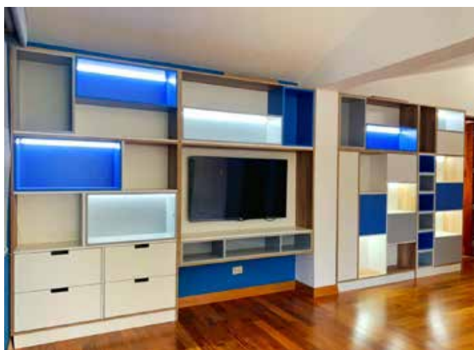
Proyecto Montero - La Planicie