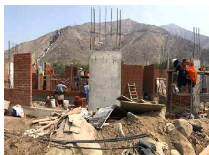
Construcción Casa de campo - Chosica